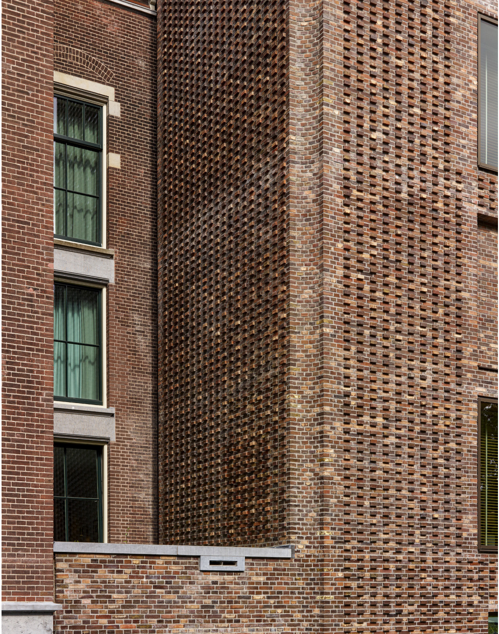
Metselwerk met reliëf in de nieuwe uitbouw