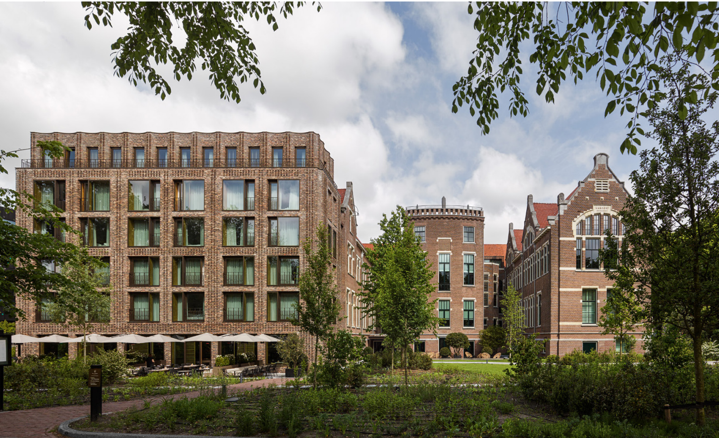
Zicht vanuit het park richting het nieuwe ensemble: het eigen terrein is ontworpen als onderdeel van het Oosterpark