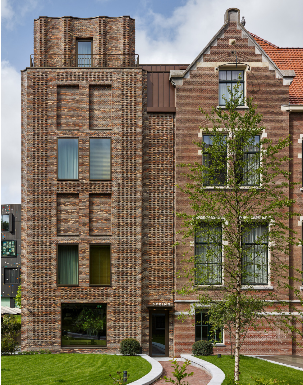
Entree brasserie Spring in de nieuwe uitbouw