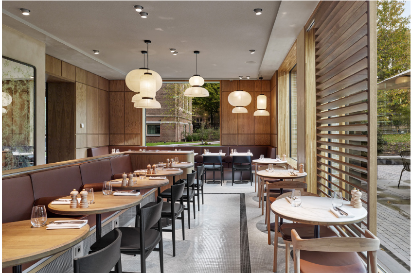
Brasserie Spring gelegen aan het park