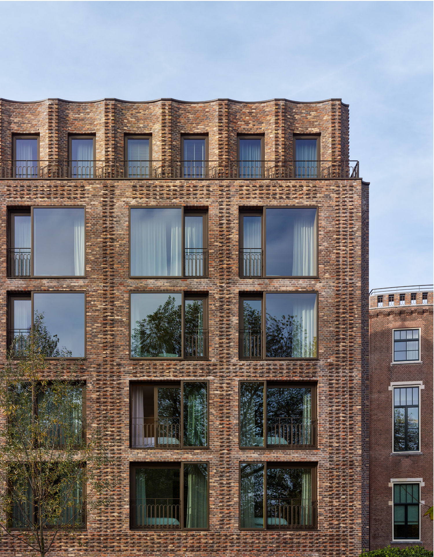
Gevelfragment: de uitbreiding en het gerestaureerde gebouw