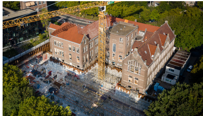
Uitvoering van de parkeerkelder en de uitbreiding, 2020