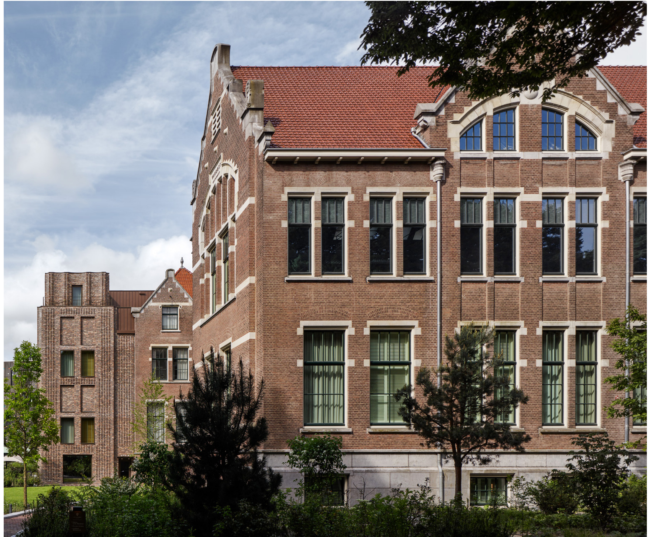
Kopgevels parkzijde, 2023

Als onderdeel van de transformatie van het Oosterpark kreeg het voormalig ontleedkundig laboratorium van de Universiteit van Amsterdam een nieuwe bestemming als een hotel ‘ Maurits at the Park ’ dat ook inwoners van de stad verwelkomt. De complexiteit van dit project – een combinatie van adaptief hergebruik, uitbreiding met een nieuwe vleugel, en integratie in het omliggende park – is typerend voor de ambitieuze benadering van Office Winhov . Binnen dit project werden het oude en het nieuwe bijeengebracht met een evenwichtig uitgewerkt programma, een zorgvuldige inpassing van de nieuwe uitbreiding en verfijnd materiaalgebruik. Het resultaat is een ontwerp dat de sterke elementen van de bestaande bouw respecteert en daar harmonieuze nieuwe elementen aan toevoegt.