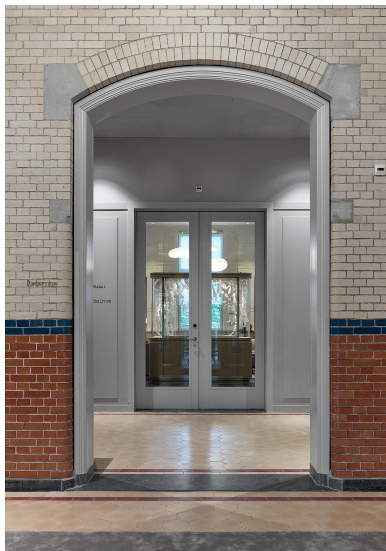
Overgang oud naar nieuw

Hoogtepunten uit het bestaande interieur zijn de muren van geglaazuurde baksteen in de gangen en de grote ruimte en spantconstructies van de vroegere museumzaal. Deze elementen zijn zichtbaar en sfeerbepalend gebleven. Office Winhov werkte nauw samen met de opdrachtgever Amerborgh , hotelmanagement IHMG en de interieurarchitecten van Studio Linse om passende interieurs met een zachte, uitnodigende uitstraling te creëren – zodat het hotel zijn nieuwe rol als gastvrij hotel dat openstaat voor het grote publiek kan vervullen, zonder zijn oorspronkelijke kwaliteiten kwijt te raken.