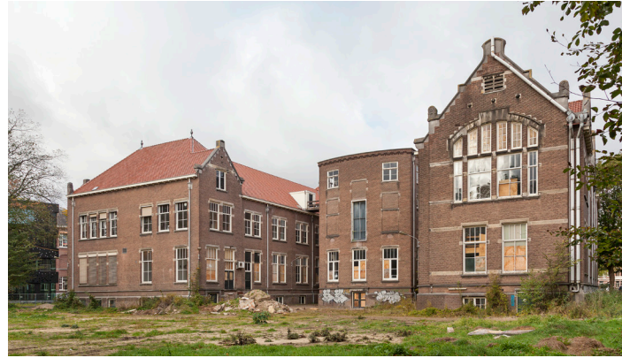
Bestaande situatie, 2017