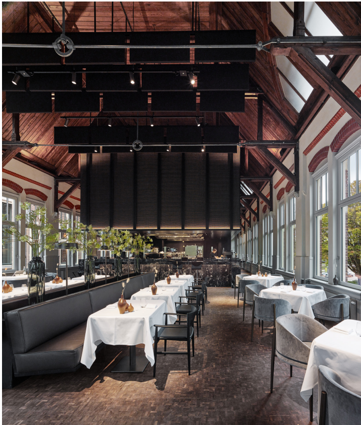
Transformatie van museumzaal tot restaurant