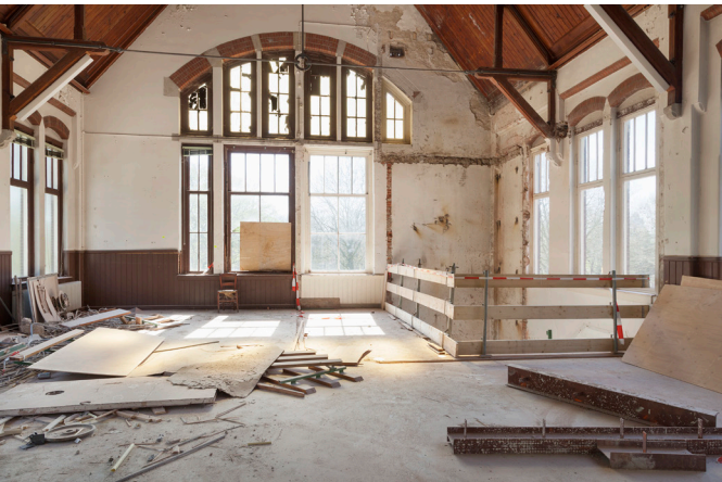
Bestaande situatie museumzaal, 2017