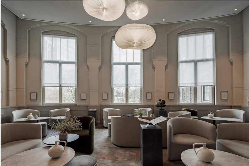
Transformatie van voormalige collegezaal tot lounge