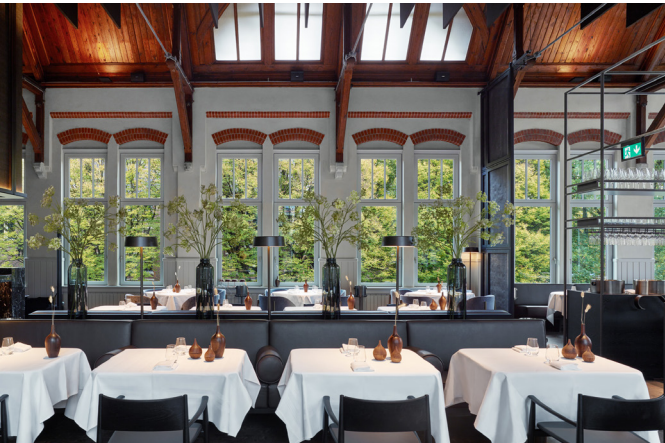
Transformatie van museumzaal tot restaurant